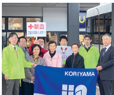
福島県代協 (2023年11月11日)