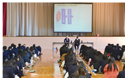
茨城県代協(2024年1月10日)