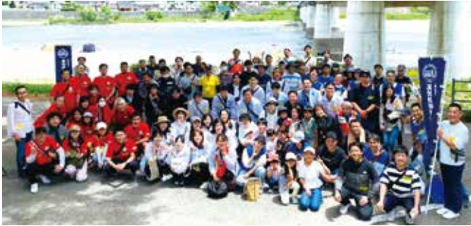
高知県代協 仁淀川清掃活動 (2023年5月27日)