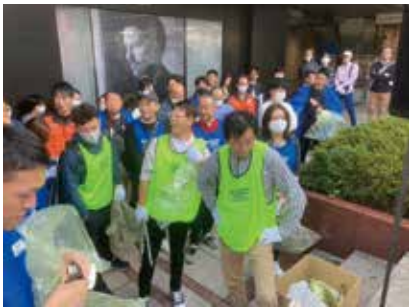
和歌山県代協 和歌山駅おもてなし大清掃 (2023年10月15日)