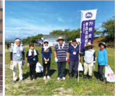
青森県代協 第38回奥入瀬川クリーン作戦 (2023年8月27日)