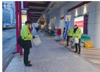
やまがた代協 (2023年11月28日)