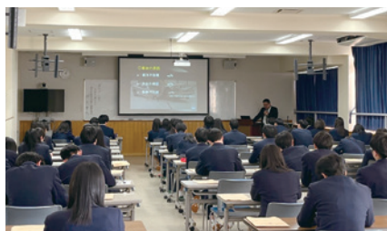
福井県代協(2024年1月17日)