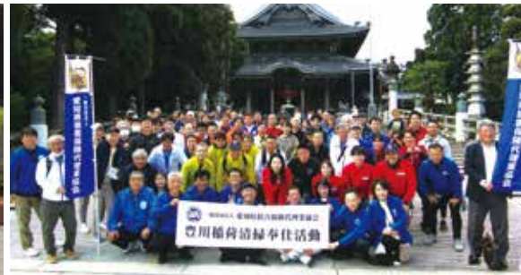
愛知県代協 豊川稲荷清掃奉仕活動 (2023年10月21日)