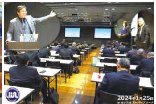
埼玉県代協 「仕事をしなくなる仕組みづくりを目指して」 (2024年1月25日)