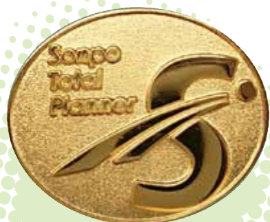
損害保険 トータルプランナー 認定バッジ

一般社団法人日本損害保険協会（損保協会）は、損保協会の「損害保険代理店専門試験」と日本代協の「保険大学校・認定保険代理士制度」を統合した「損害保険大学課程」を、2012年7月から展開しています。この制度の運営にあたり、日本代協は指定教育機関として、教育プログラムの策定・運営を行い、業界全体の募集人教育を支援しています。