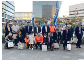
鹿児島県代協 (2023年10月25日)

日本代協は、新潟県中越地震が発生した10月を「地震保険の月」と定め、「地震保険の保険金は被災時の生活再建資金となり、生活の早期安定に資する」ことを毎年全国で訴えています。