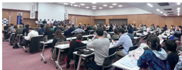
大分県代協 「『温故知新』と『居安思危』で大地震を凌ぎ『転禍為福』」 (2023年10月28日)