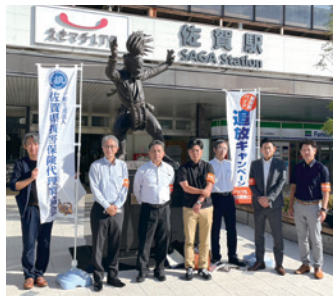
佐賀県代協 (2023年9月25日)