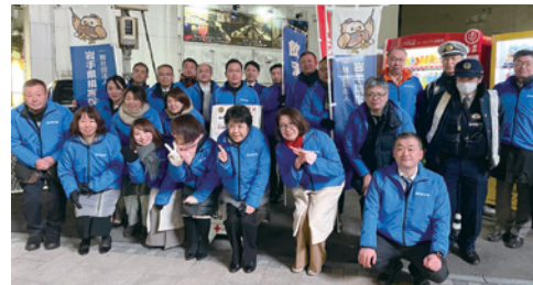
岩手県代協 飲酒運転撲滅街頭キャンペーン (2023年12月1日)