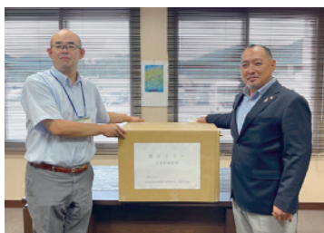
北海道代協 タオルボランティア (2023年8月9日)