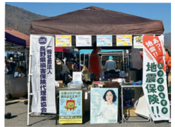
長野県代協 (2023年12月9日)