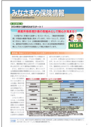
『みなさまの保険情報』

お客さまに常に新しい情報をお届けするためのツールとして、情報誌「みなさまの保険情報」（年4回発行）を代協会員に郵送し、現在約5万部が利用されています。