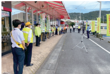
山口県代協 夏の交通安全キャンペーン (2023年7月13日)