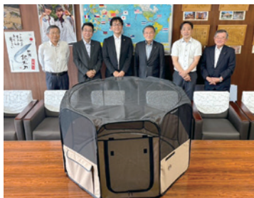
熊本県代協 ペット同行避難所用 折りたたみ サークル寄贈(2023年7月10日)