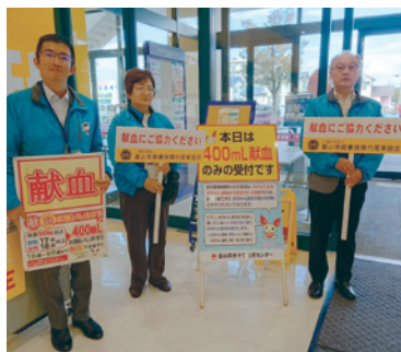
富山県代協 (2023年10月29日)