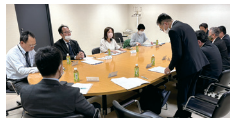
岐阜県代協(2023年11月14日)