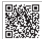
代理店賠償『日本代協新プラン』のご案内