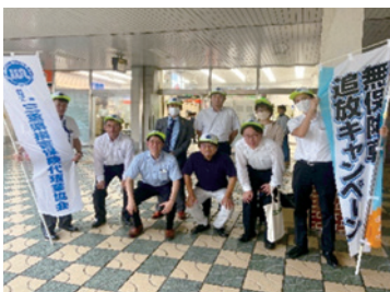
三重県代協 (2023年9月15日)

交通事故が起きた場合、被害者だけでなく、加害者にも賠償責任義務による金銭的負担や精神的負担が強いられます。日本代協では、毎年9月に国土交通省と共同で、交通事故被害者の対人賠償の確保と加害者の経済的負担を補う自賠責保険の普及を目的とした「無保険車追放キャンペーン」を実施しています。