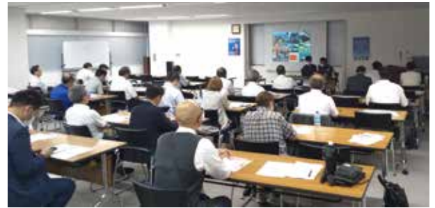
岡山県代協 「日本赤十字社による献血推進セミナー」(2023年7月5日)

日本代協、各都道府県代協は、会員向けに「経営マネジメント」や「防災・減災の取り組み」等、本業に資する様々なセミナーを開催しています。また、総会や賀詞交歓会、記念式典等に保険会社等の業界関係者を招待し、交流を深めています。