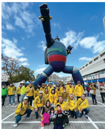
兵庫県代協 「第11回神戸マラソン」ボランティア (2023年11月19日)