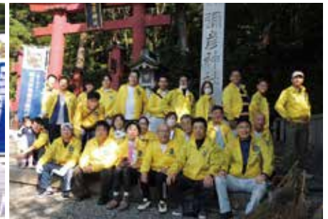
新潟県代協 弥彦神社清掃 (2023年11月3日)