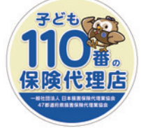
「子ども110番の保険代理店」ステッカー