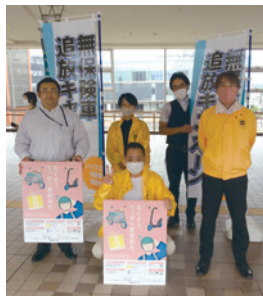
秋田県代協 (2023年9月21日)