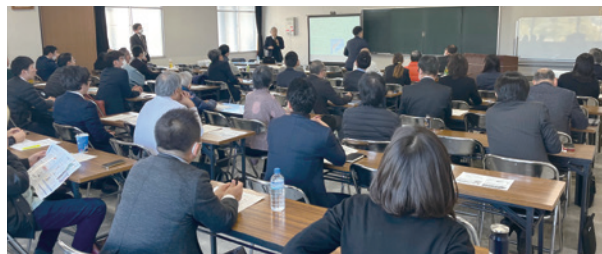
鳥取県代協 「山陰の地震と日本列島の大地変」(2024年1月17日)