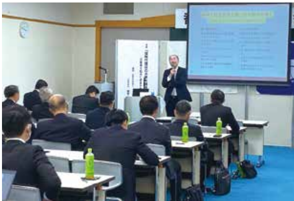
香川県代協 「保険代理店の未来を継承する心構え ～お客様を起点に成長か撤退かを決める～」 (2023年5月29日)