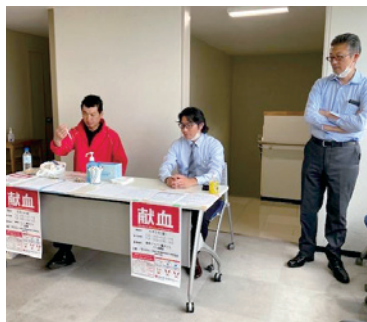
神奈川県代協 (2023年6月2日)