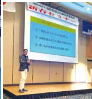
滋賀県代協 「簡単！すぐにできる！ 自分を変えるメンタル睡眠心理」 (2024年1月23日)