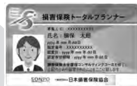
顔写真付き認定証イメージ

顔写真付き認定証・認定バッジを使用できます。また「損害保険トータルプランナー」という称号と、シンボルマークを名刺等に使用できます。